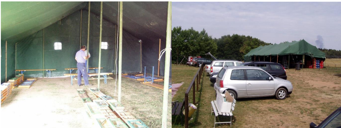
Der Aufbau am Donnerstag und Freitag.