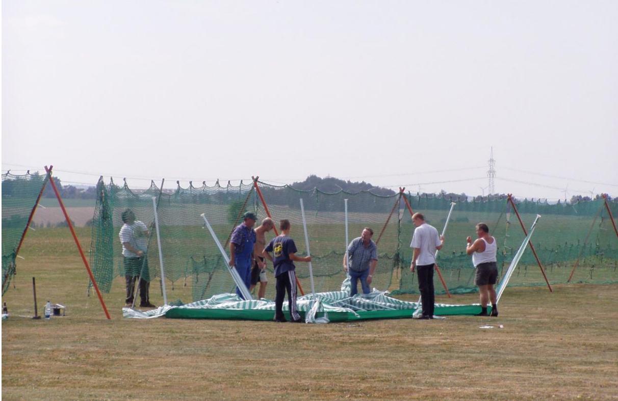
Ohne Fangnetz geht es nicht.