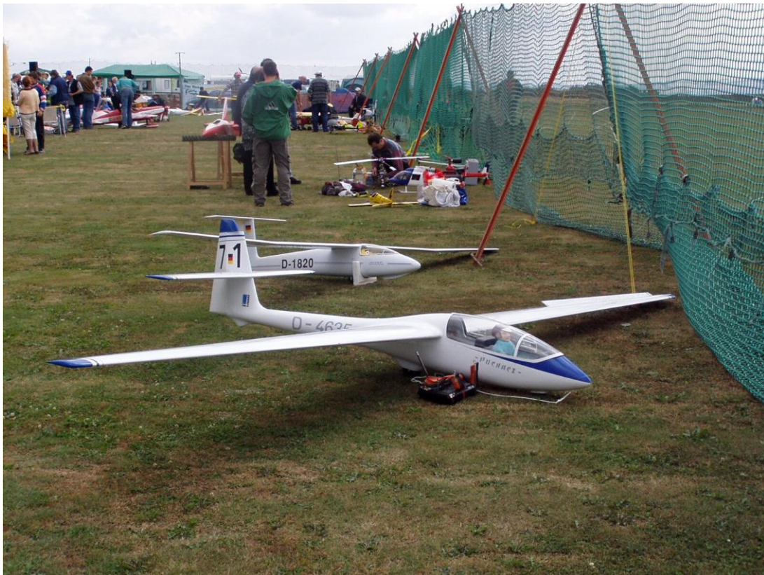
Segelflugzeuge Puchacz und Pirat im Vordergrund, Magnum Speedmodell (gelb), Helis und Jet im Hintergrund.