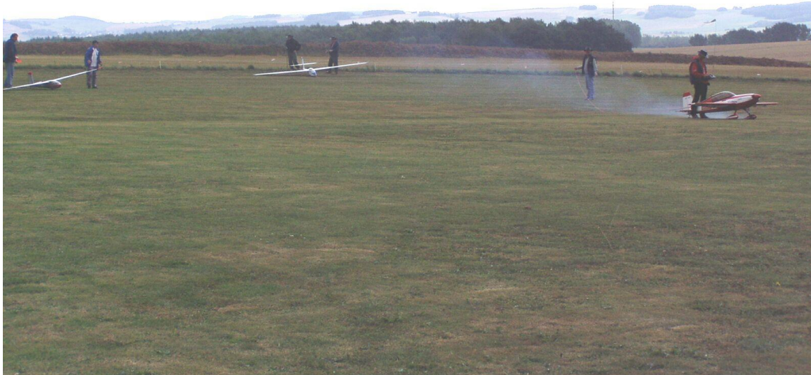
Segler-Doppelschlepp mit einer Extra.