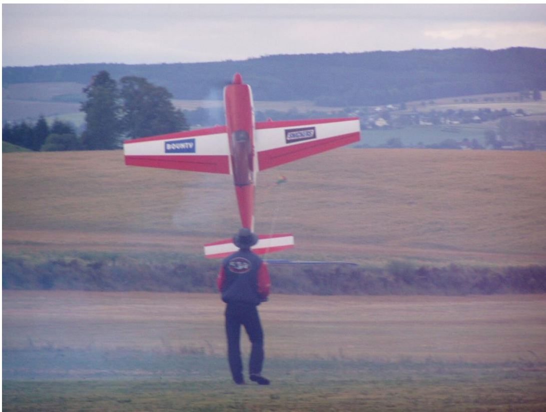
Kunstflugzeuge, wie diese Extra, hingen bereits 2003 an der „Latte“.