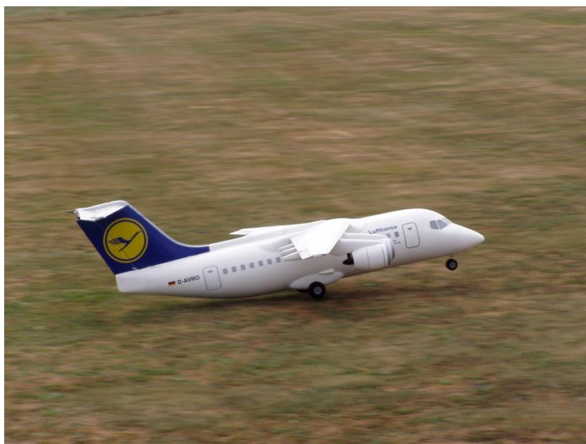
Impeller-Jet BAE-146 „Jumbolino“ von Robbe. Noch mit Bürstenmotoren!