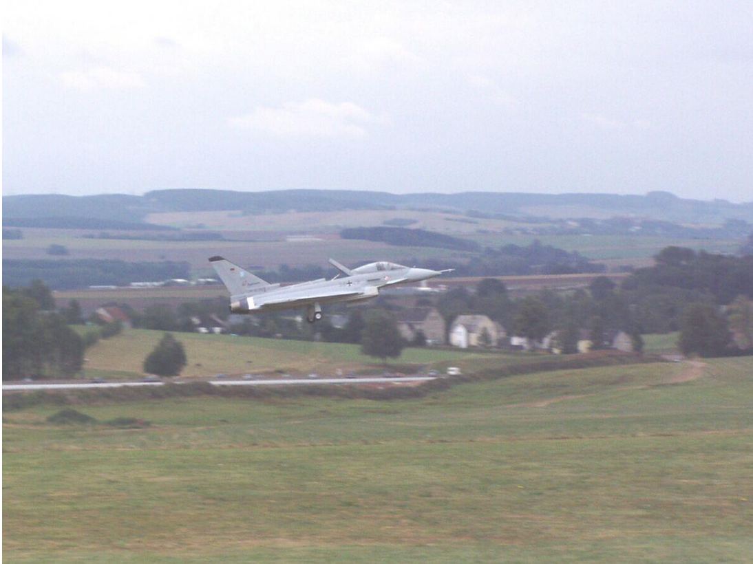
Eurofighter mit Turbinenantrieb.