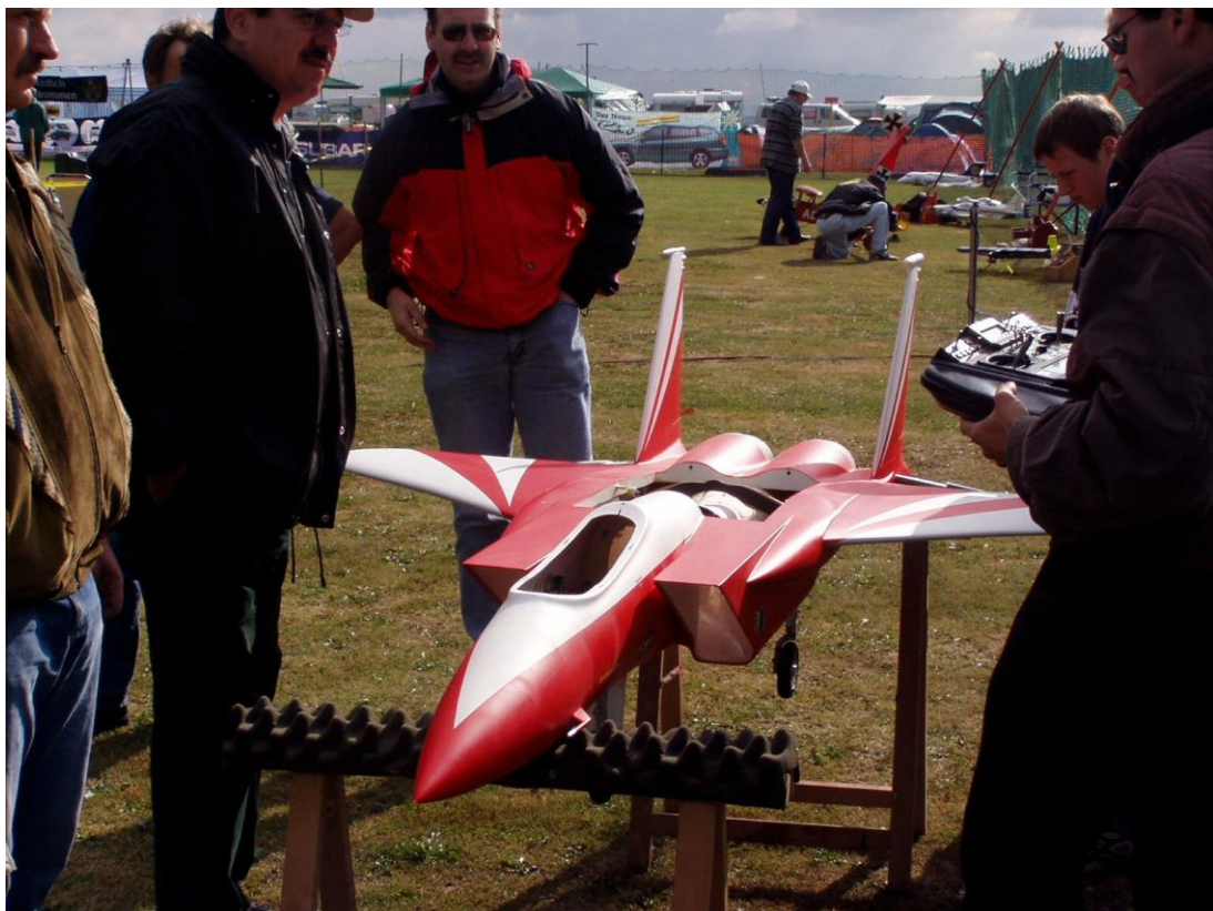
F15 mit Turbinenantrieb und pneumatischem Einziehfahrwerk.