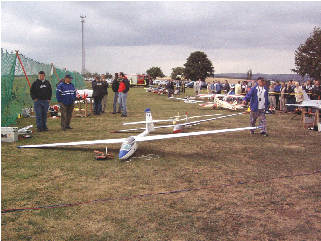
Zuschauer und Piloten waren da, es konnte los gehen.